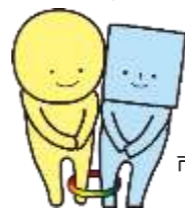
市民社協キャラクター あいあい