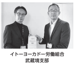
イトヨーカドー労働組合 武蔵境支部

「小さな親切」運動 武蔵野 市支部 ▶ 30,000円/イ トヨーカドー労働組合 武蔵境支部 ▶ 13,600円 /(株) 浩仁堂 ▶ 7,850円 /(学) 二葉総合学園 吉 祥寺二葉栄養調理専門職 学校、吉祥寺二葉製菓専門職学校 ▶ 160,000円/匿名 2件 ▶ 14,000円