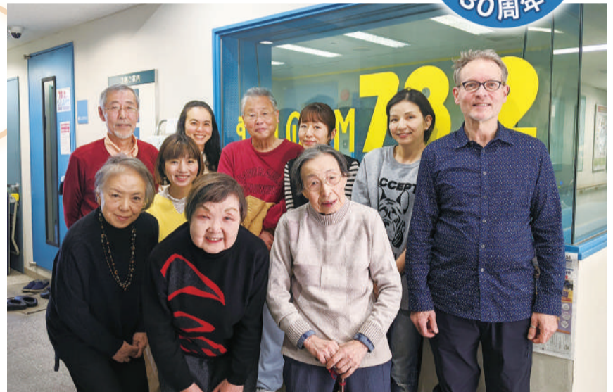
メンバーのみなさん

むさしのFM市民の会の活動は市民であればどなたでも参加可能です。また、市内在住だけでなく在勤・在学の方もメンバーになることができます。毎週金曜日の午後16時10分に定例会議が開催されていますので、関心のある方はまず参加してみてくださいはいかがでしょうか？