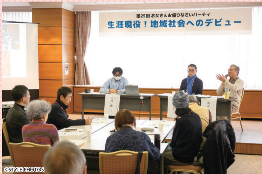
第1部 トークセッション