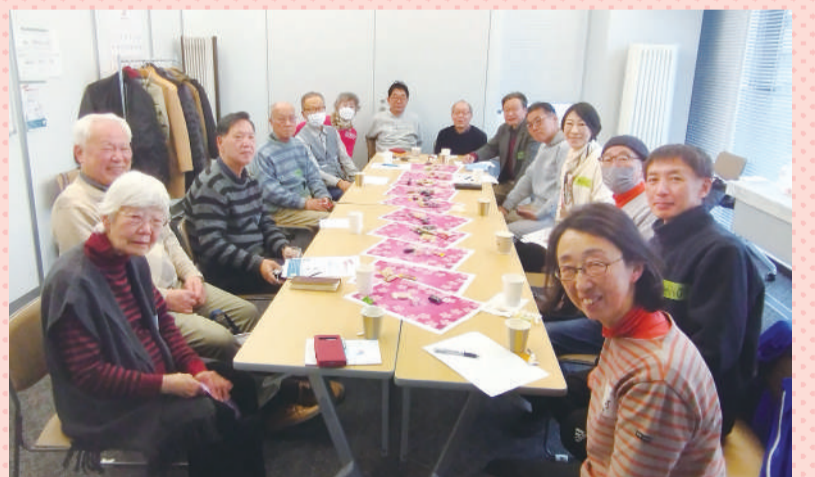
3月6日おとばプロジェクト会議@市民社協会議室

それから1ヶ月後の3月6日。第25回「おとば」に集った仲間たちが、市民社協の会議室で再会しました。未来へつながる一歩を自分の足で踏み出そうとしている仲間たちです。人生100年と言われるように、定年後は“時間を持て余す”という表現ではおさまらないほど時間はたっぷりあり、これは“お父さん”に限ったことではありません。何が生まれるのか、モヤモヤのままなのか、挑戦は続けたいと再会した仲間たちと誓いました。