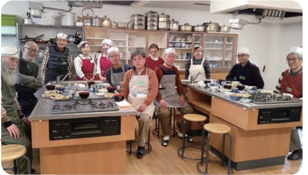
参加者とスタッフのみなさん

男性のみなさん、普段ご自分で料理をされますか？ 中町と御殿山2丁目エリアで活動している中央福祉の会では、 一緒に料理をしながら交流する「男の料理教室」を行っています。