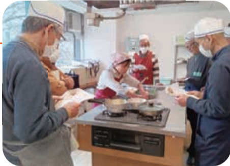
テキストを見ながら手順をチェック