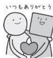
いつもありがとう