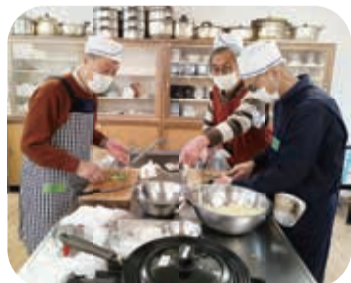
チームワークで作ります

最初はメニュー選びや材料の買い出し、調理のレクチャーもすべて福祉の会のメンバーで行っていましたが、現在は近隣にあるテンミリオンハウス・くるみの木のスタッフが講師として関わってくれ、栄養バランスや調理時間を考慮したメニューを講師と相談して決めています。