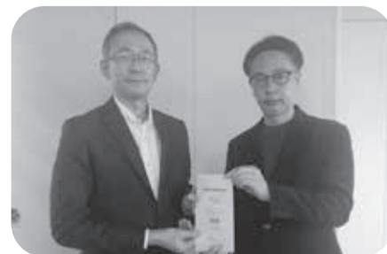
イトーヨーカドー労働組合 武蔵境支部

使用済み切手やインクカートリッジは専門業者に買い取ってもらい、その収益を市民社協が行う地域福祉活動の財源として活用しています。使用済み切手については、買い取り前にボランティアの方々に整理していただいています。