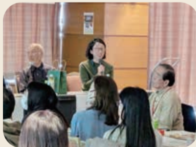
パネルトークには女性のゲストスピーカーも