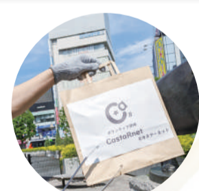
拾ったごみは団体のロゴマーク入りの袋に集めます。