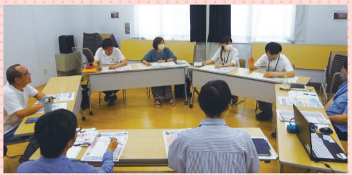
隔月開催の「広報委員会」で今後の方針や取材内容などを決めていきます。ここで交わされる意見はとっても貴重です

◆こんなメンバーです♪ 始まりは令和3年、「市民社協だより ふれあい」紙面のリニューアルを機に、地域により密着した広報紙づくりのため、市民公募によって現広報委員が誕生しました。現在8名がボランティアとして「ふれあい」(隔月刊)の作成に参加しています。 具体的には別表のように、広報委員会への出席、取材・原稿作成・校正が主な仕事です。メンバーの経歴は多種多様。広報紙の経験者やフリーの編集者、ボランティア活動の主宰者や従事者、そして年代も20歳代~70歳代とバラエティに富んでいます。