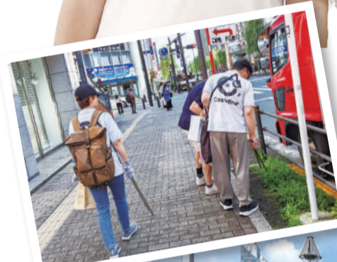
清掃活動は毎月第2土曜 10:00～(夏季9:00～) 吉祥寺駅北口駅前広場 はな子像の前で集合します