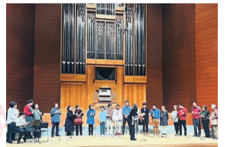
コンサートで日ごろの練習の成果を披露。本人も親も緊張しますが、かけがえない瞬間です