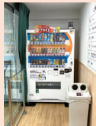
▲高齢者総合センター