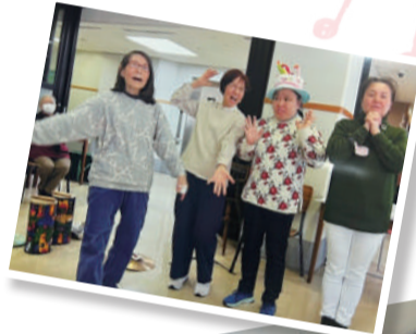
練習は真剣に、でも楽しくにぎやかに! 手にする楽器は修理に修理を重ねて使っています