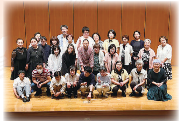
つばさ音楽クラブのみなさん

今月は、市内各地で恒例の「歳末たすけあい・地域福祉活動募金」が行われます。でも募金するときに、いったいどのように使われているのか気になりませんか?今回は一例として、募金の助成先の団体「つばさ音楽クラブ」にお話を聞いてみました。