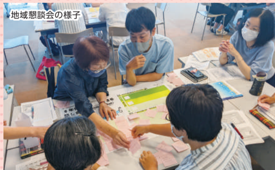
地域懇談会の様子