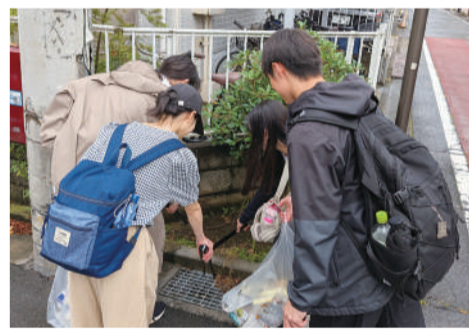
「ゴミ拾い中にグループメンバー同士どれだけお互いを知り、仲良くなったか？」を終了後にクイズで競うことになっており、初対面の人も自然と会話が生まれました

次世代プロジェクトでは今後もボランティアの輪を広げていくため、様々な企画を続けていくことにしています。よかったらみなさんもボランティアを始めてみませんか。 (取材・記事: 広報委員 重岡秀俊)