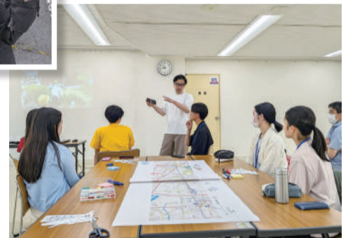
2日目のワークショップの様子