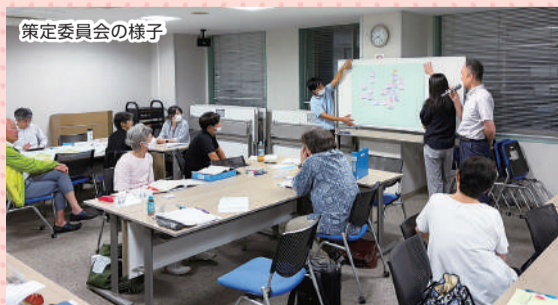
策定委員会の様子